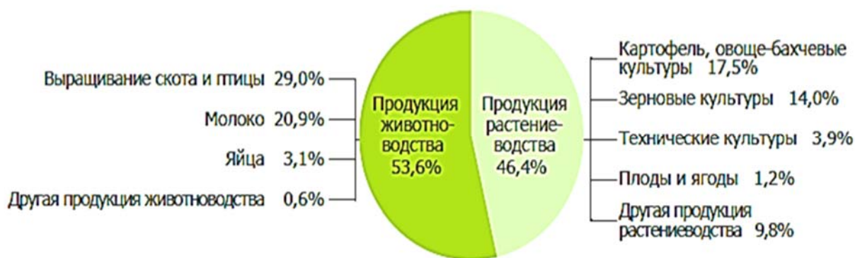
Рисунок 1 – Структура производства продукции сельского хозяйства в хозяйствах всех категорий в 2014 году (в процентах к итогу; в текущих ценах)

Растениеводство в Беларуси в значительной мере подчинено нуждам животноводства. т.к. сельское хозяйство специализируется на производстве животноводческой продукции. Биоклиматический потенциал республики соответствует требованиям интенсивного ведения растениеводческой отрасли и при соблюдении технологических норм позволяет получать достаточно высокую урожайность сельскохозяйственных культур.